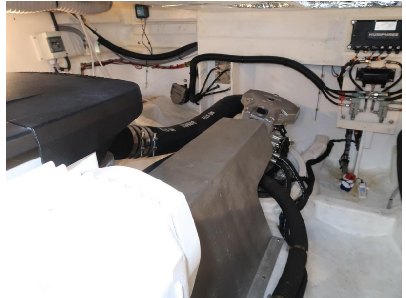
EXTERIOR + INTERIOR LAYOUTS