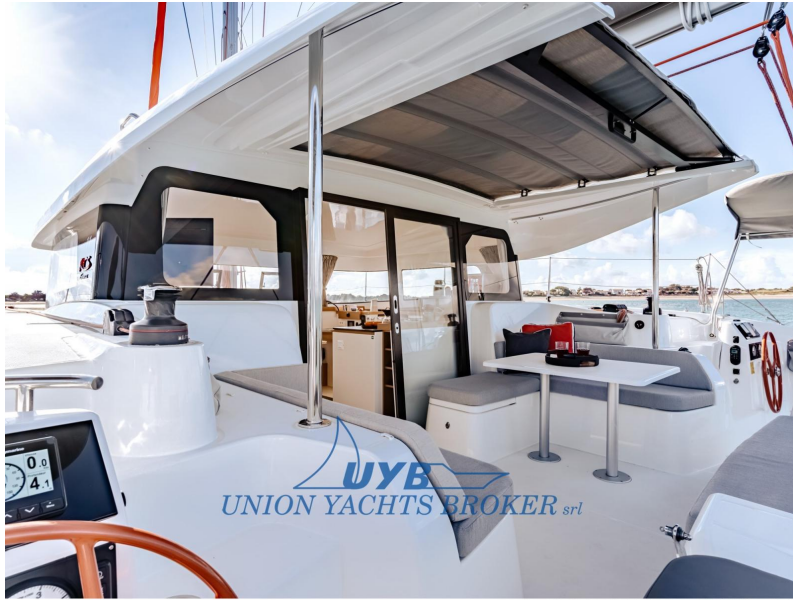
Excess 11 - Mention obligatoire/Mandatory credit: Photo Nicolas Claris