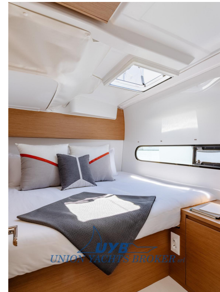
Excess 11