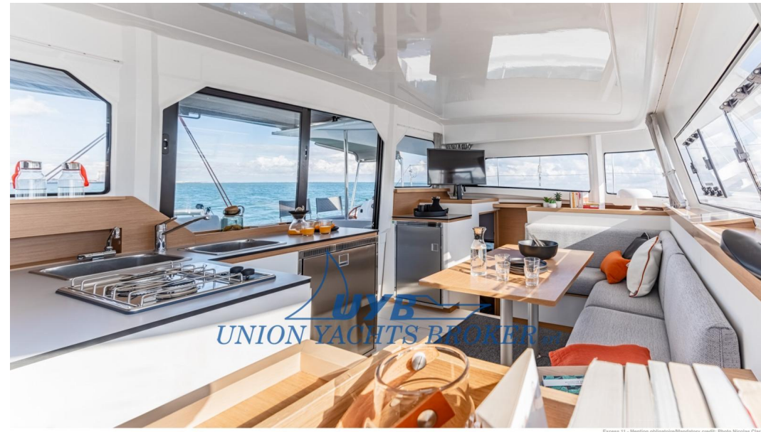
Excess 11 - Mention obligatoire/Mandatory credit: Photo Nicolas Claris