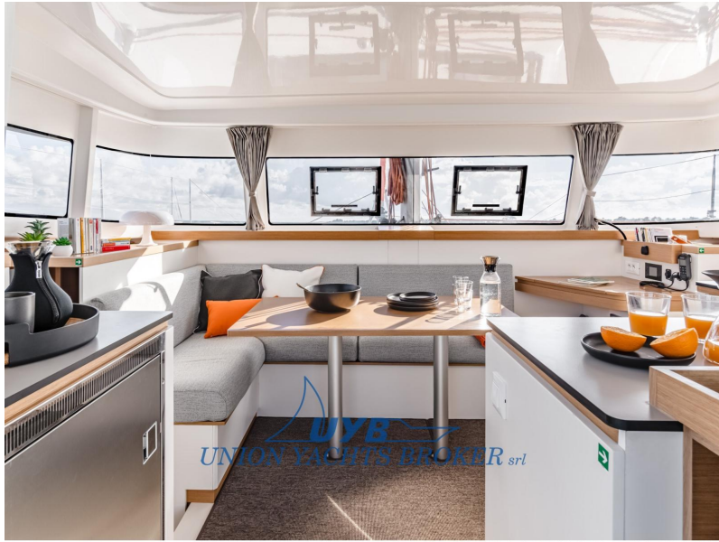
Excess 11