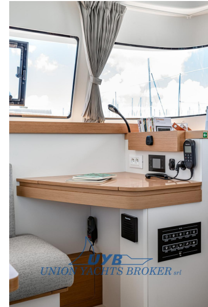
Excess 11