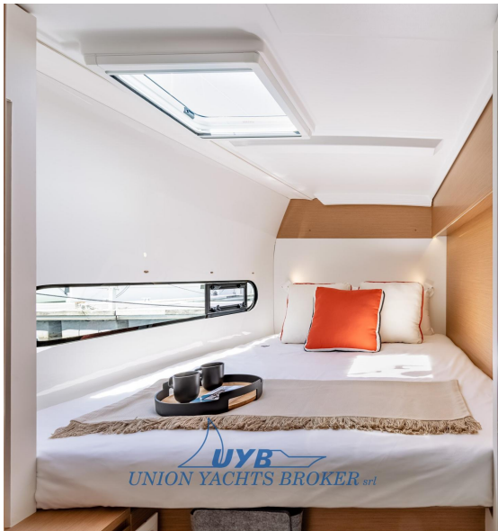
Excess 11 - Mention obligatoire/Mandatory credit: Photo Nicolas Claris Excess 11 - Mention obligatoire/Mandatory credit: Photo Nicolas Claris