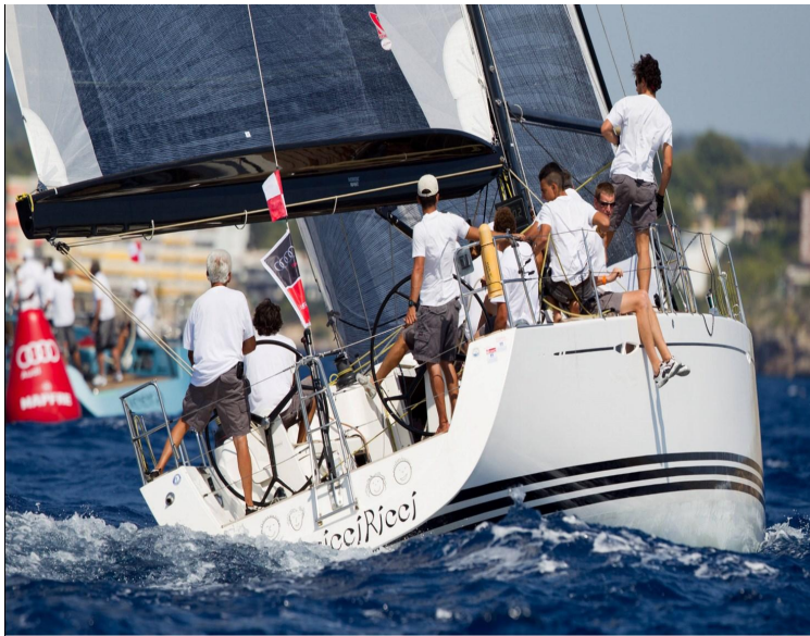
Capocannon - RC2