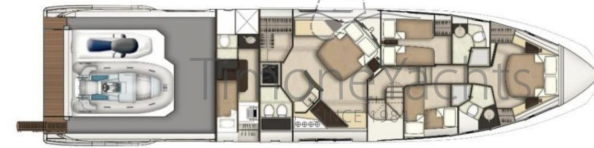
AZIMUT S7 - LOWER DECK