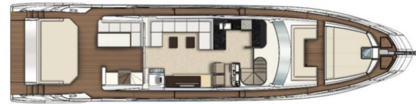
AZIMUT S7 - MAIN DECK