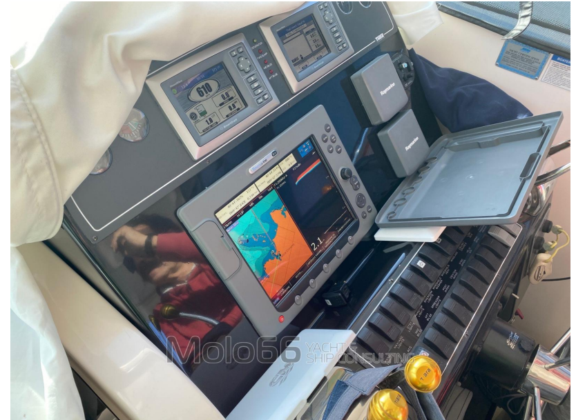
Molo66 YACHT & SHIP CONSULTING