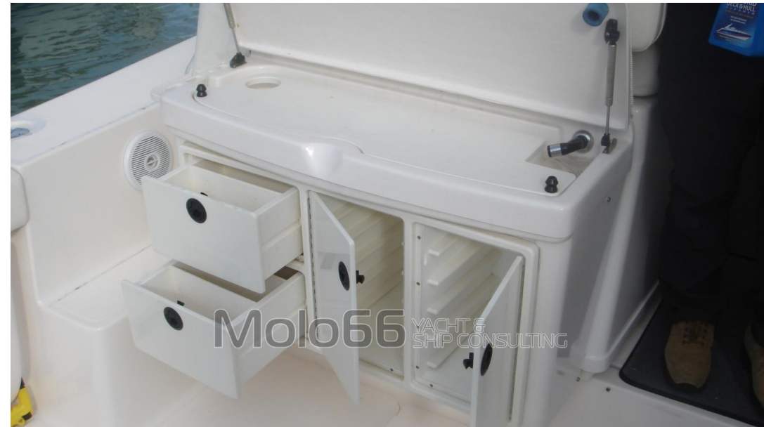
Molo66 YACHT & SHIP CONSULTING