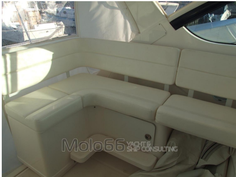
Molo66 YACHT & SHIP CONSULTING