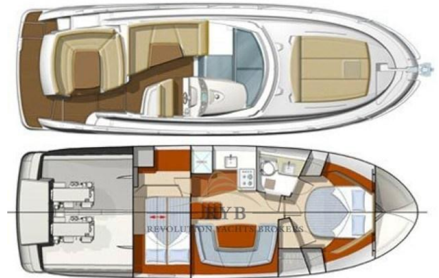
Garroni Designers - JEANNEAU Prestige 38 s - octobre 2007