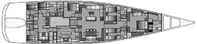
SWAN 115 FD