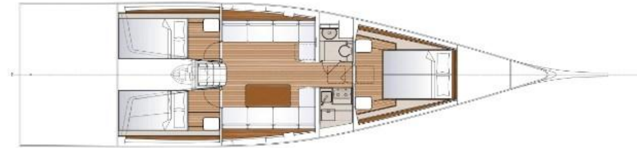
with options (3 cabins)