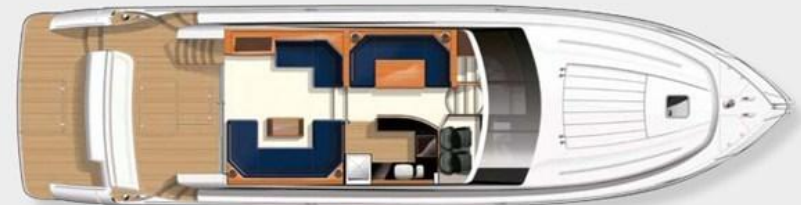
Upper accommodation layout