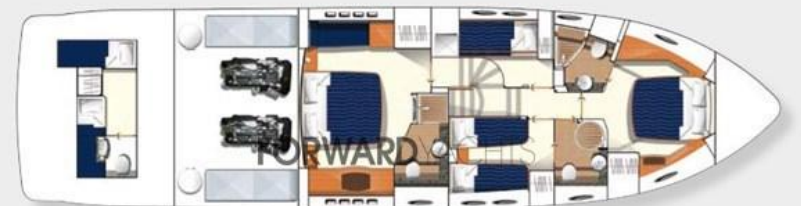
Lower accommodation layout