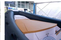
PRENDISOLE DI PRUA

I sedili per guidatore e copilota sono indipendenti e sono progettati per garantire un buon supporto laterale durante la navigazione in condizioni di mare agitato.