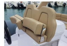
SEDILE DI GUIDA

La consolle ha una grande porta nella parte anteriore, con sedile integrato, che aprendosi rivela una zona bagno con wc con scarico elettrico.