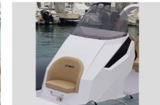
CONSOLLE DI GUIDA - VISTA FRONTALE

La vista laterale della consolle di guida mostra il design moderno e sofisticato che si adatta perfettamente alla funzionalità, offrendo spazio per un agevole passaggio verso prua.