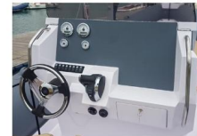
CONSOLLE DI GUIDA - CRUSCOTTO

La consolle di guida ha un ampio cruscotto per l'installazione della strumentazione motore, ampi schermi GPS, VHF, stereo, interruttori e molti altri controlli.