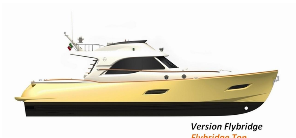
Version Flybridge Flybridge Top