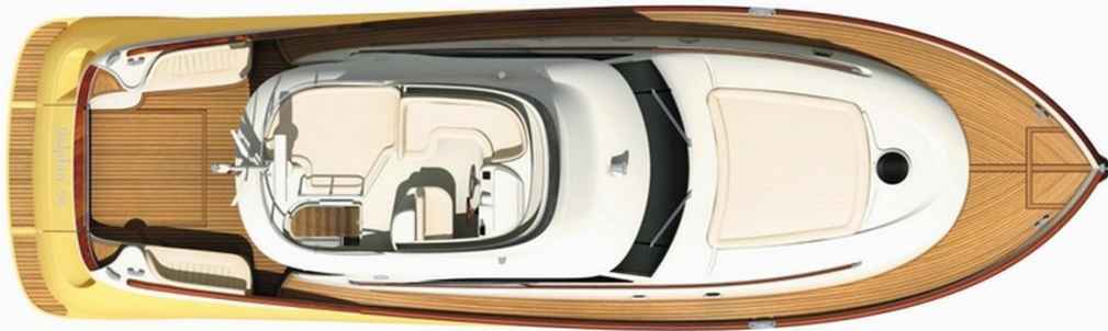
Version Flybridge Flybridge Top