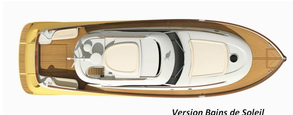
Version Bains de Soleil Suntop