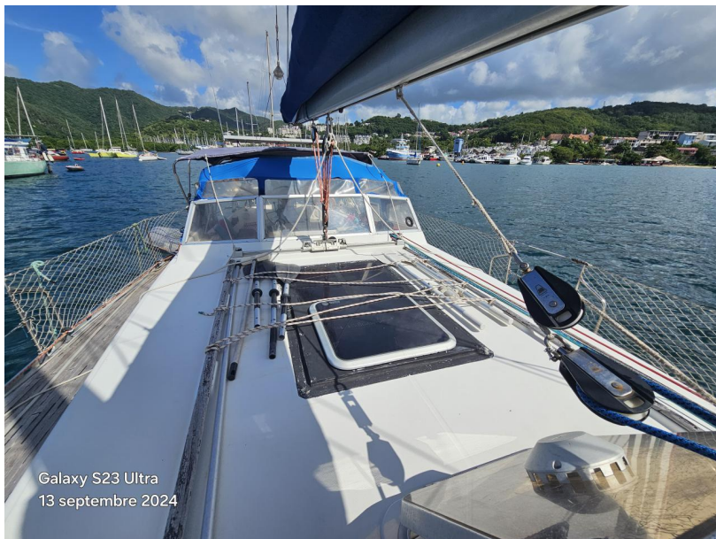
Galaxy S23 Ultra 13 septembre 2024