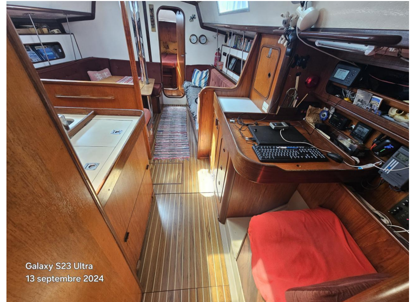
Galaxy S23 Ultra 13 septembre 2024