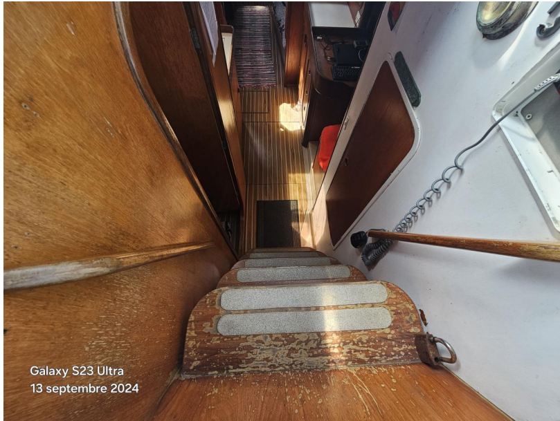
Galaxy S23 Ultra 13 septembre 2024