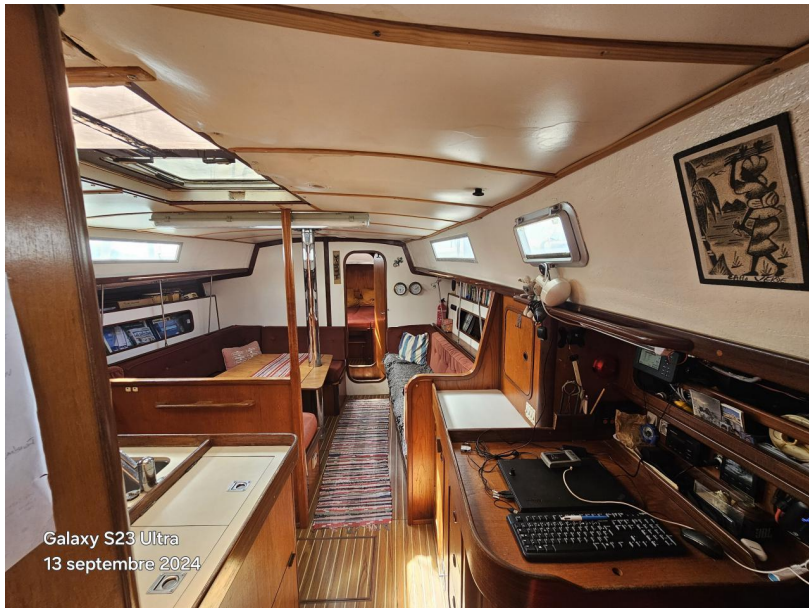
Galaxy S23 Ultra 13 septembre 2024