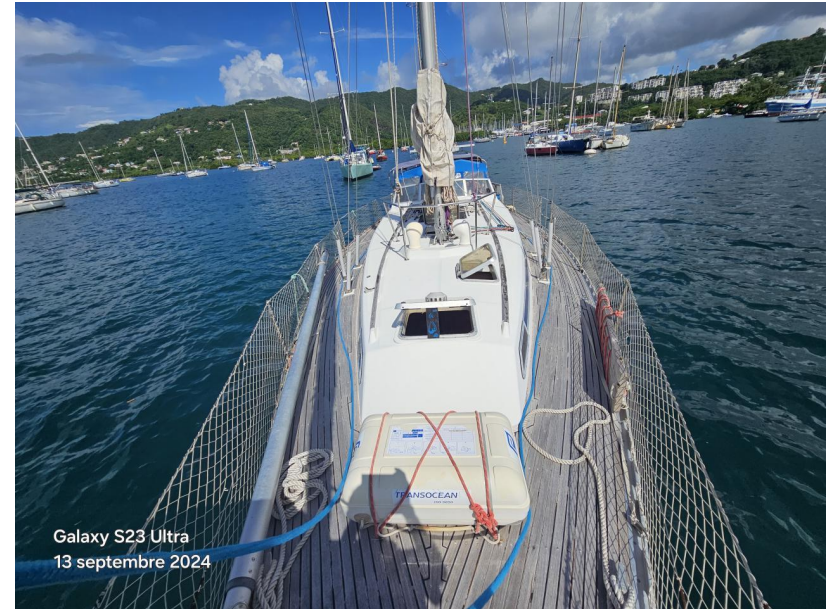
Galaxy S23 Ultra 13 septembre 2024