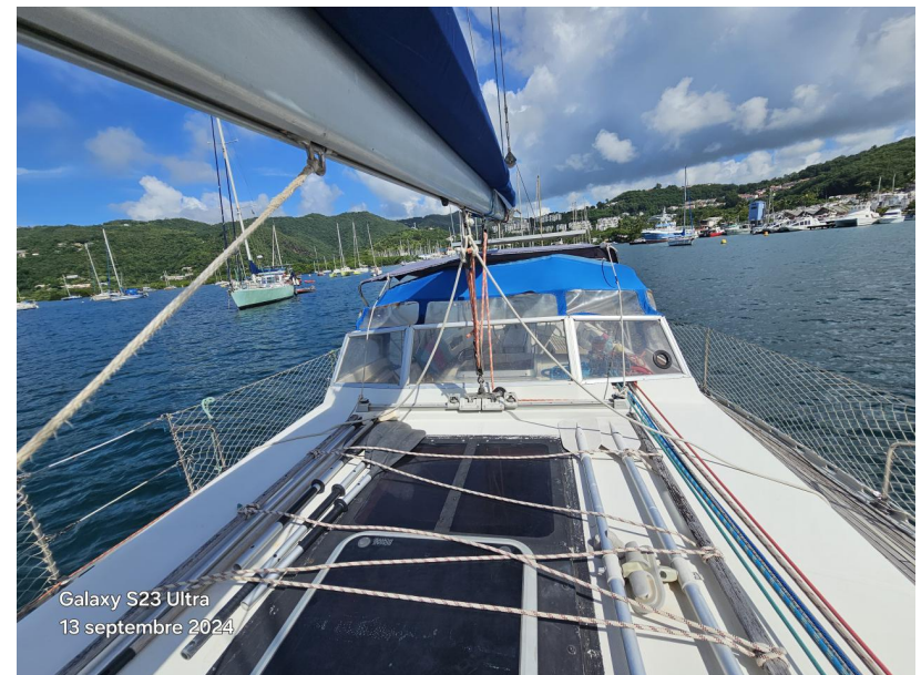
Galaxy S23 Ultra 13 septembre 2024