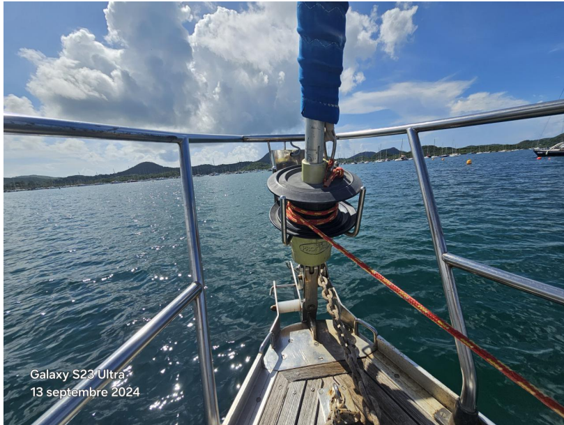
Galaxy S23 Ultra 13 septembre 2024