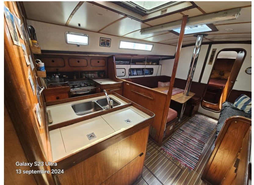
Galaxy S23 Ultra 13 septembre 2024