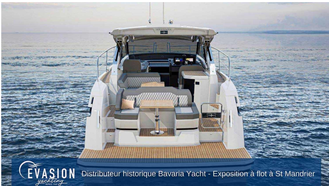
EVASION Distributeur historique Bavaria Yacht - Exposition à flot à St Mandrier