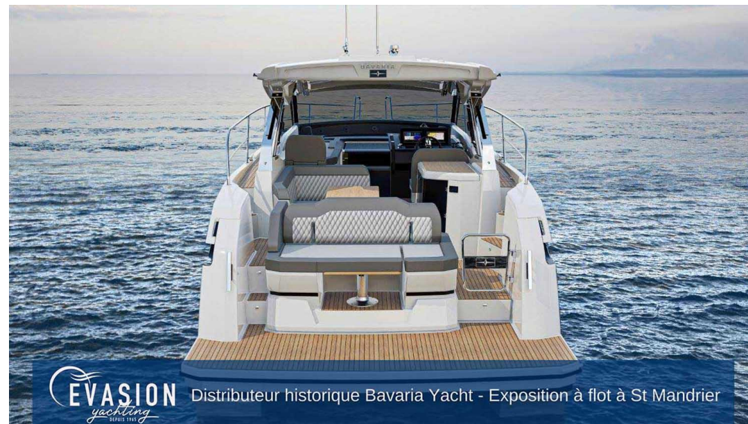
EVASION Distributeur historique Bavaria Yacht - Exposition à flot à St Mandrier