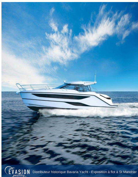
EVASION Distributeur historique Bavaria Yacht - Exposition à flot à St Mandrier