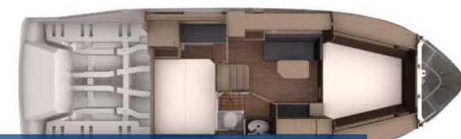
BAVARIA EVASION Distributeur historique Bavaria Yacht - Exposition à flot à St Mandrier