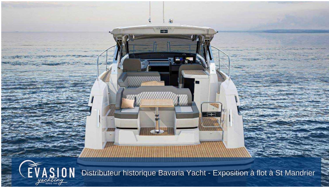
Exterior side view