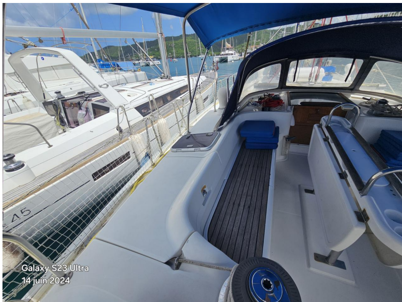
Galaxy S23 Ultra 14 juin 2024