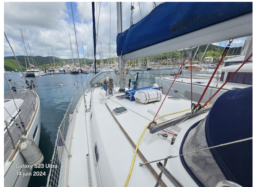
Galaxy S23 Ultra 14 juin 2024