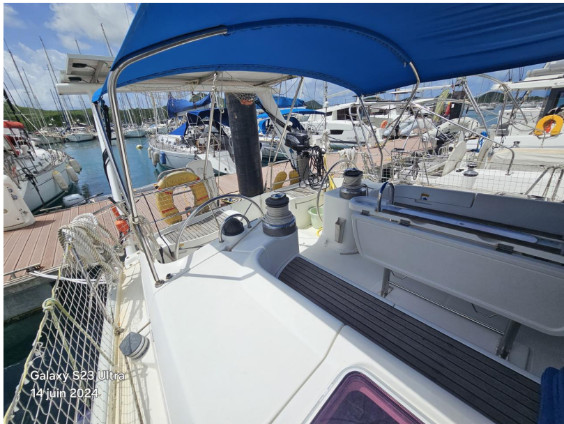
Galaxy S23 Ultra 14 juin 2024