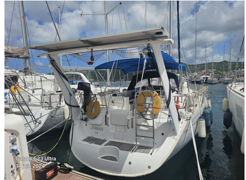
Galaxy S23 Ultra 14 juin 2024