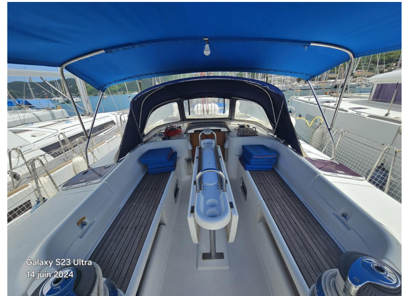
Galaxy S23 Ultra 14 juin 2024