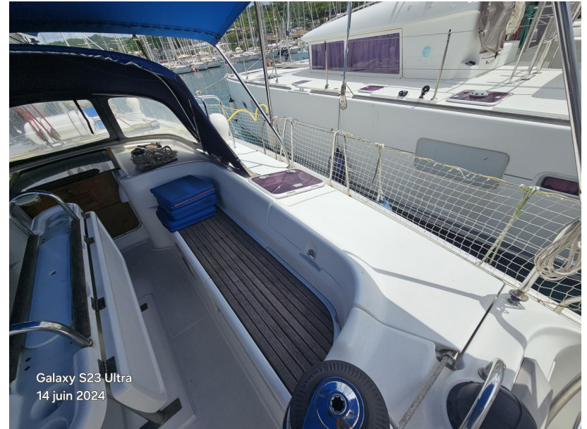
Galaxy S23 Ultra 14 juin 2024