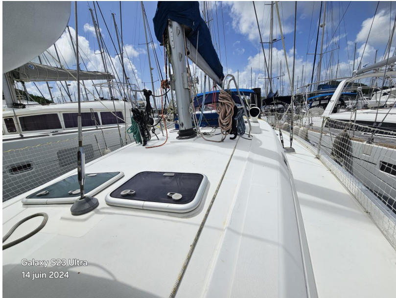
Galaxy S23 Ultra 14 juin 2024