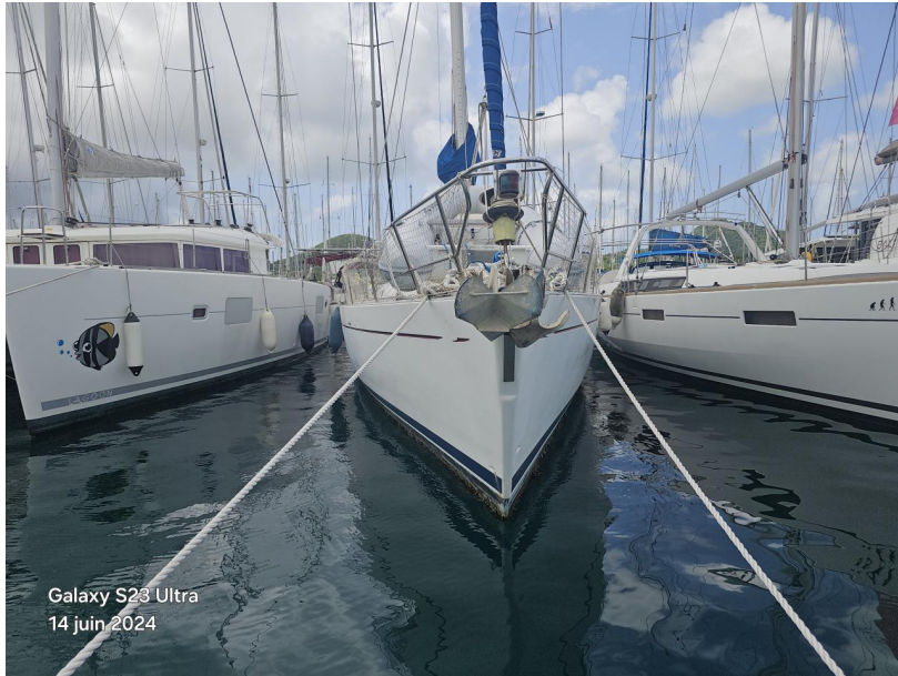
Galaxy S23 Ultra 14 juin 2024