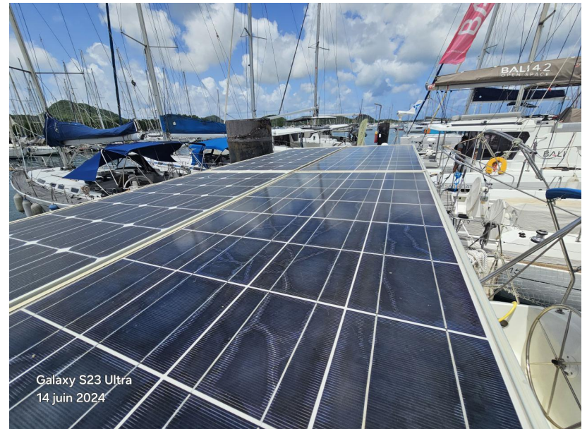
Galaxy S23 Ultra 14 juin 2024