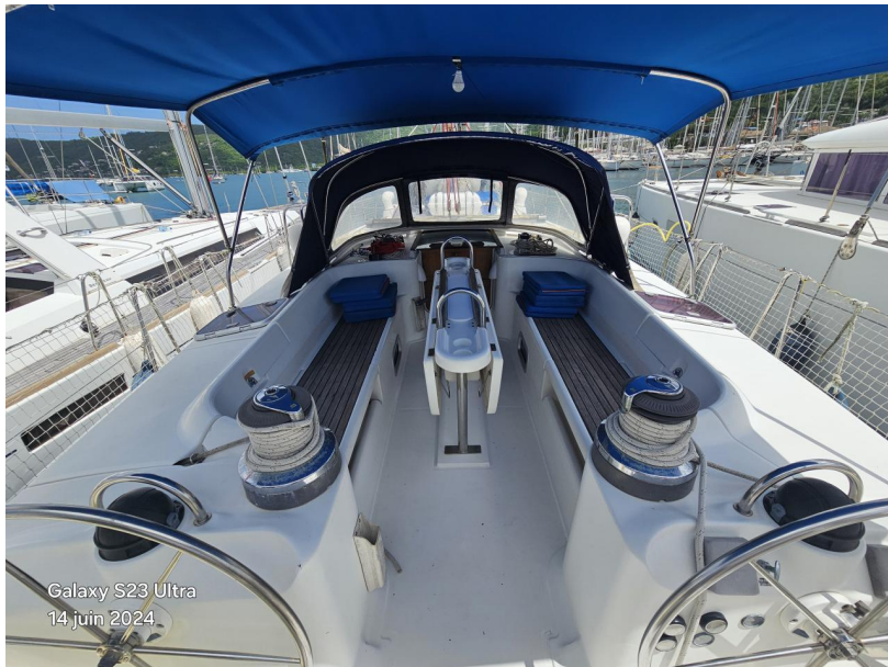
Galaxy S23 Ultra 14 juin 2024