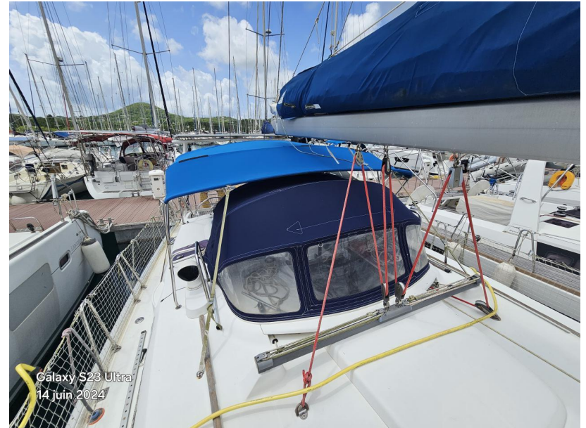
Galaxy S23 Ultra 14 juin 2024