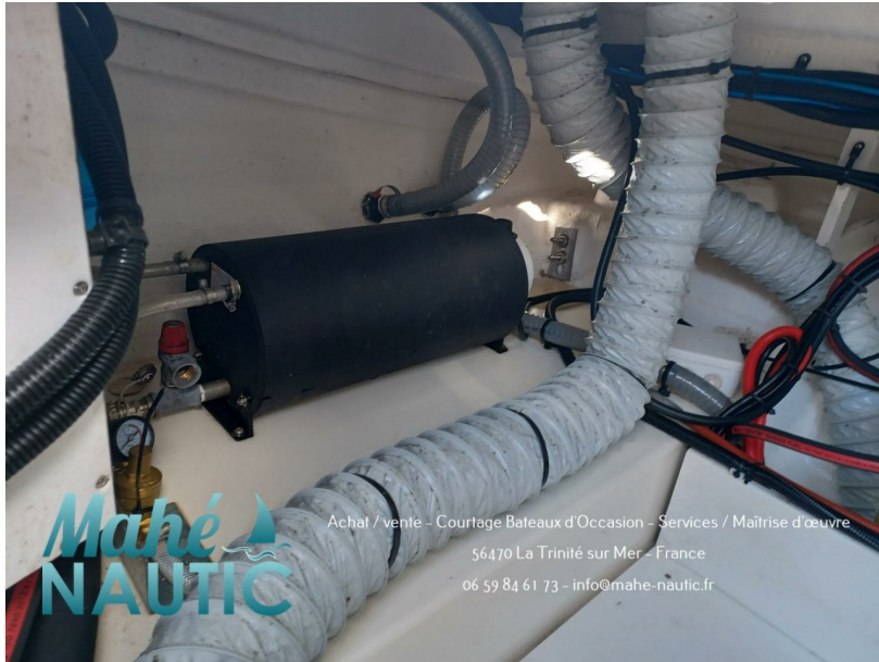
Achat / vente - Courtage Bateaux d'Occasion - Services / Maîtrise d'œuvre 56470 La Trinité sur Mer - France 06 59 84 61 73 - info@mahe-nautic.fr