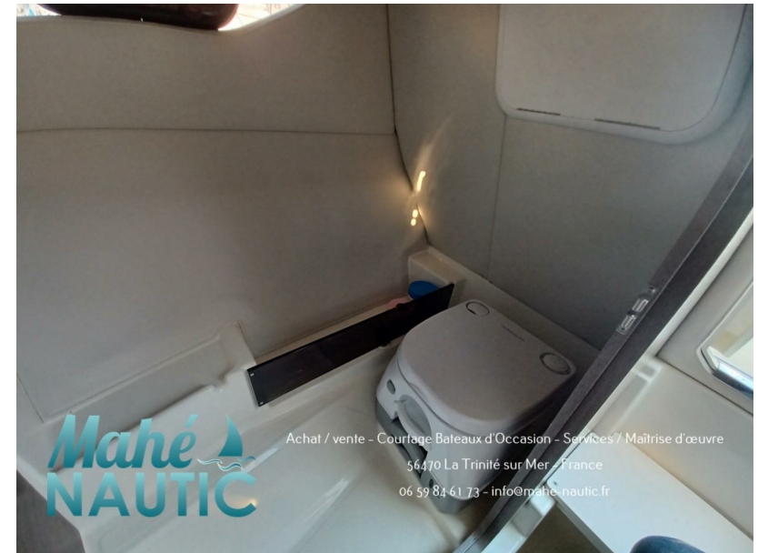
Achat / vente - Courtage Bateaux d'Occasion - Services / Maîtrise d'œuvre 56470 La Trinité sur Mer - France 06 59 84 61 73 - info@mahe-nautic.fr