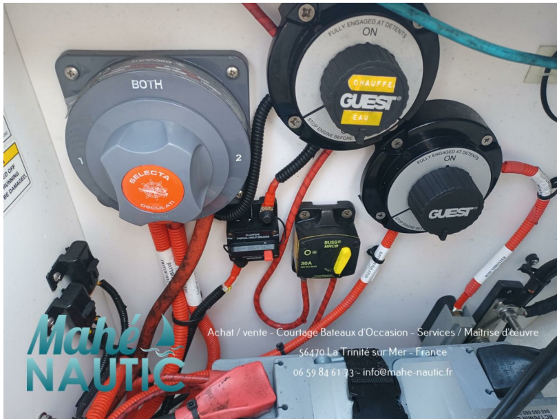
Achat / vente - Courtage Bateaux d'Occasion - Services / Maîtrise d'œuvre 56470 La Trinité sur Mer - France 06 59 84 61 73 - info@mahe-nautic.fr