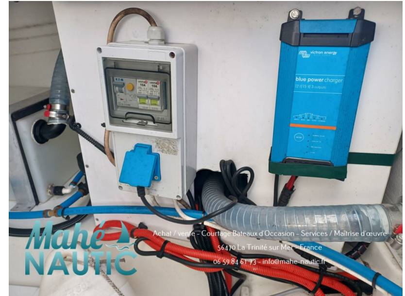
Achat / vente - Courtage Bateaux d'Occasion - Services / Maîtrise d'œuvre 56470 La Trinité sur Mer - France 06 59 84 61 73 - info@mahe-nautic.fr