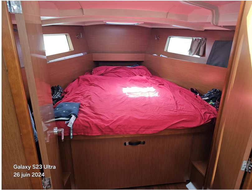
Galaxy S23 Ultra 26 juin 2024