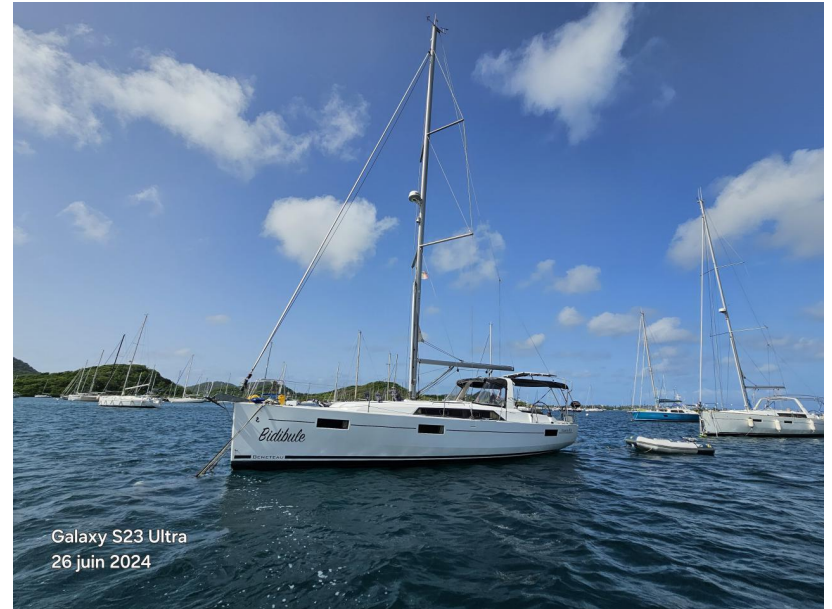
Galaxy S23 Ultra 26 juin 2024