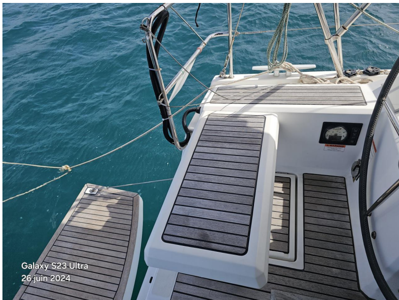
Galaxy S23 Ultra 26 juin 2024