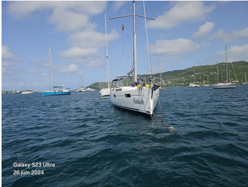
Galaxy S23 Ultra 26 juin 2024