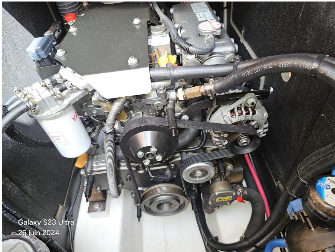
Galaxy S23 Ultra 26 juin 2024