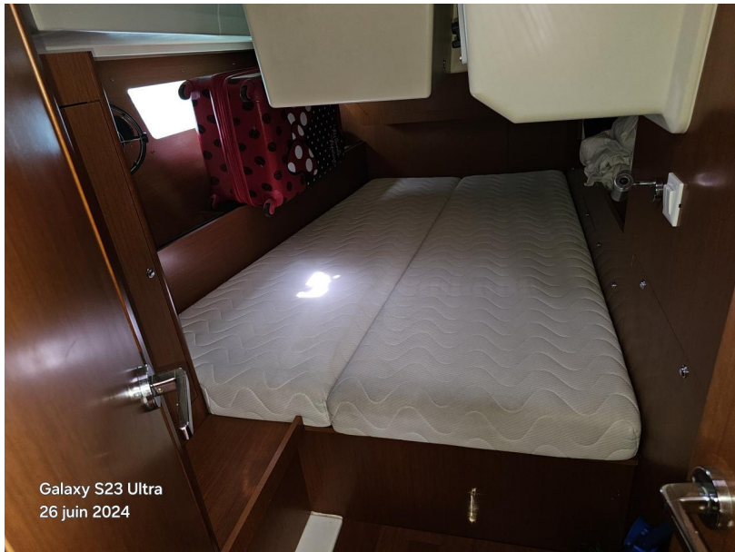
Galaxy S23 Ultra 26 juin 2024