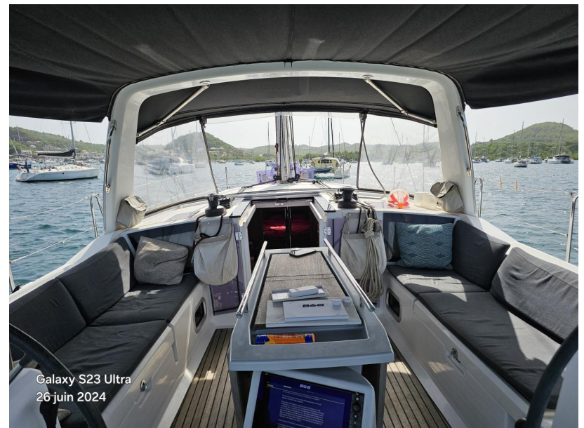
Galaxy S23 Ultra 26 juin 2024