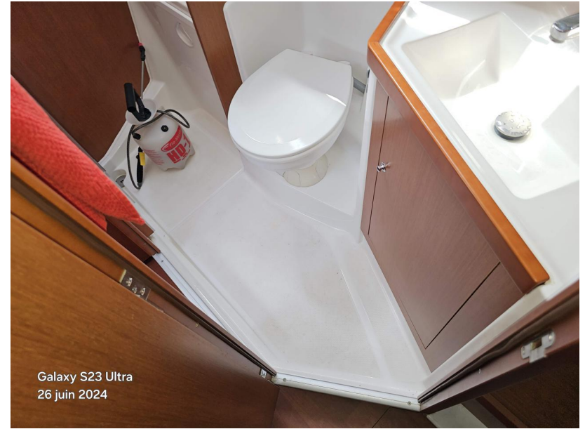
Galaxy S23 Ultra 26 juin 2024