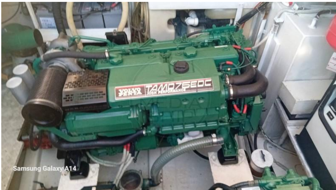
Samsung Galaxy A14