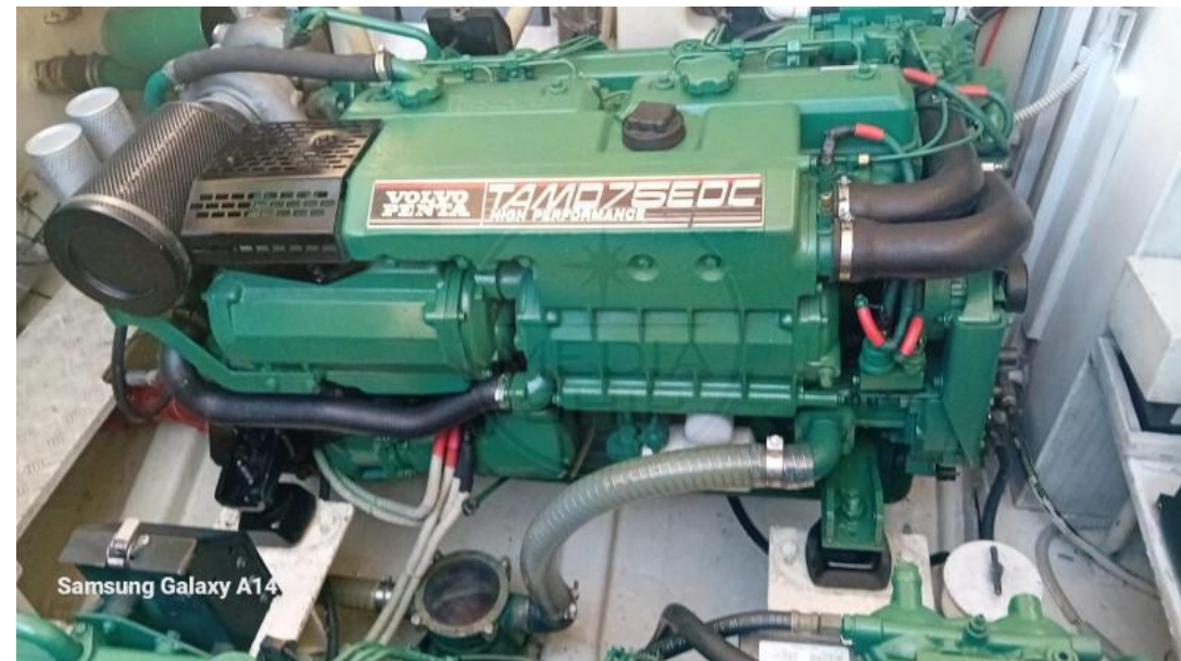
Samsung Galaxy A14