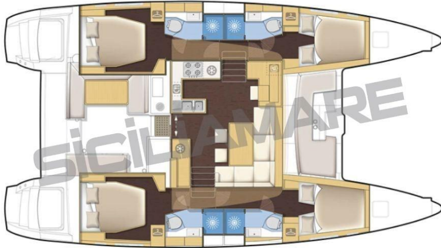
version 4 cabines / 4 cabins version