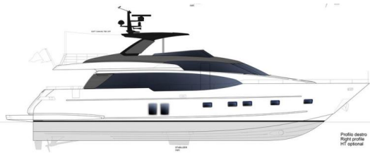
Profilo esterno Right profile RT optional