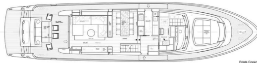
Ponte Coperta Main deck