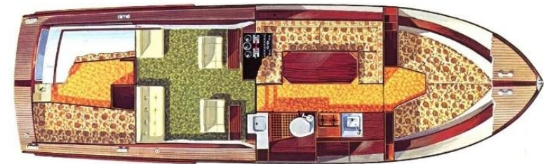
Storebro Royal Cruiser 34 - Layout del 1975